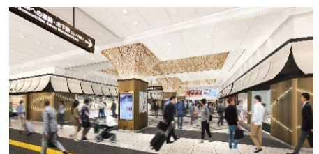
東京ギフトパレット 外観イメージ

混合物を含めない100%の再生アルミとして、商業施設の装飾に使用することは初の取り組みであり、2020年3月26日にアルミニウム産業における技術の進歩等に顕著な貢献をした個人・団体に贈られる令和元年度一般社団法人日本アルミニウム協会賞「開発賞」を受賞しました。