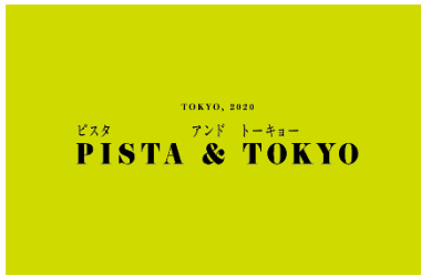
PISTA & TOKYO ロゴ・商品イメージ

日本一のバレンタインイベントであるジェイアール名古屋タカシマヤの「2020アムール・デュ・ショコラ」でデビューしたピスタチオスイーツ専門店『PISTA & TOKYO(ピスタ アンド トーキョー)』が初の常設店をオープンするほか、身体に優しい原料を使用したお菓子とお茶を提供するギフト専門店『カドー ナチュラル』が東京駅に初出店します。