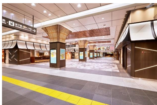
<東京ギフトパレット外観>

U R L： https://www.tokyoeeki-1bangai.co.jp/tokyogiftpalette/ （東京ギフトパレット 特設サイト）