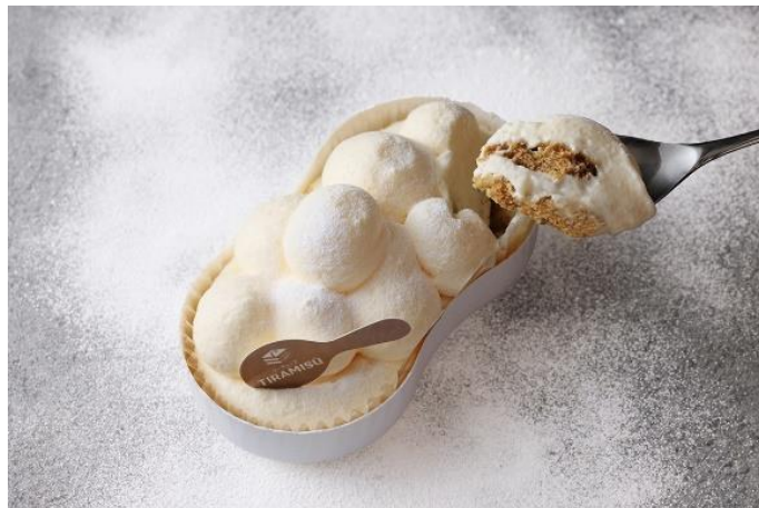
＜ホワイトティラミスラテ＞

この度、初出店となる『シーキューブ TIRAMISÙ』は、シーキューブ（※1）創業時からの看板商品である「ティラミス」にフォーカスをあてた、カジュアルユースでありながら本格的な味や香りにこだわったティラミス専門店です。口溶けの良いエアリーなクリームが特徴的な「ホワイトティラミスラテ」や気軽にティラミスを楽しめる「ひとくちティラミスタルト」、手土産にぴったりな焼き菓子「ティラミス ラング・ド・シャ」などの東京ギフトパレットでしか味わえない限定スイーツのほか、シーキューブのロングセラー商品「焼きティラミス」などを取り揃えて、様々なティラミスの味や香り、製法、形状、召し上がり方を提案します。