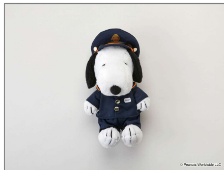
★● スヌーピータウンミニ