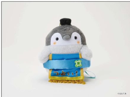
★●◆ コウベンちゃん はなまるステーション