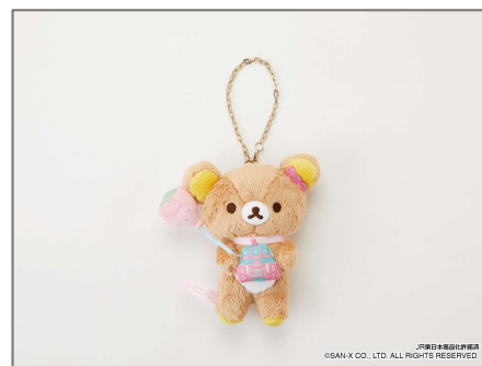
★● リラックマストア