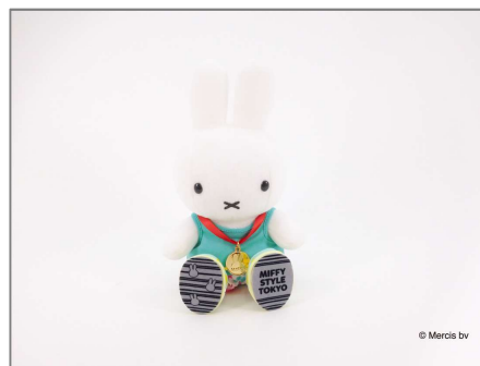
★● miffy style