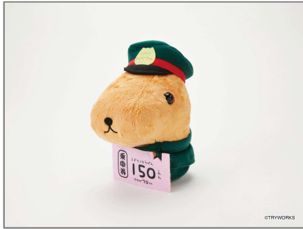
★● カピバラさんキュルッとショップ