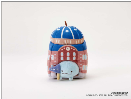
★● すみっこぐらし shop