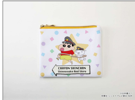
★● クレヨンしんちゃんオフィシャルショップ