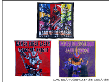
★ 仮面ライダーストア