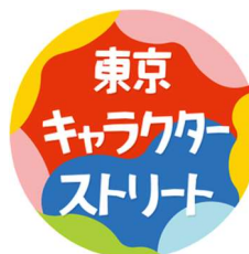
東京キャラクターストリート Instagram アカウントロゴマーク

※キャンペーンの注意事項等詳細は、Instagram プレゼントキャンペーンの告知投稿にてご確認ください。