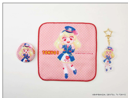
★● アイカツ! デザインマート(12/10 OPEN)