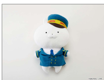
★●◆ LINE CREATORS SHOP