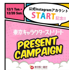
東京キャラクターストリート Instagram キャンペーン投稿画像