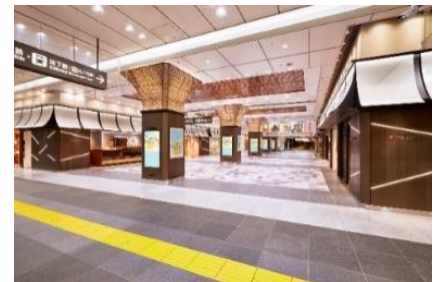
<東京ギフトパレット 外観>

U R L： https://www.tokyoeki-1bangai.co.jp/tokyogiftpalette/