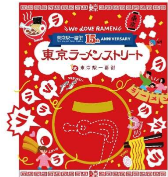
東京ラーメンストリート フォトスポット