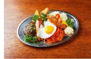
大人様ランチ (レギュラー)

HIGHBALL BAR 東京駅1923 (東京グルメゾーン) 1,364円 (税抜)