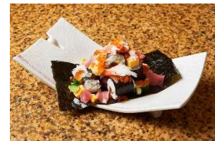
東京駅限定メニュー 海鮮極み盛り ～令和(2020)～

HIGHBALL BAR 東京駅1923 (東京グルメゾーン) 1,364円 (税抜)