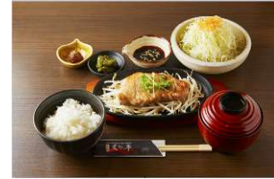
黒豚のステーキ定食

URL: https://www.tokyoeki-1bangai.co.jp/15thanniversary/