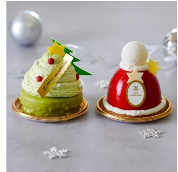
◀左：サパン・ドウ・ピスターーシュ / 右：サンタの帽子▶

クリスマスツリーをケーキで表現し、クリスマスを楽しんで頂けるデザインにしております。ピスタチオブラウニーの土台にピスタチオブリュレ、ピスタチオクリームとまさにピスタチオ尽くしのクリスマスにぴったりのケーキです。センターにはピスタチオの美味しさをさらに引き立ててくれる柔らかいフランボワーズのコンフィチュールを入れ、甘味と酸味のバランスを取っております。