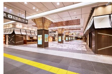
東京ギフトパレット外観

U R L： https://www.tokyoeki-1bangai.co.jp/tokyogiftpalette/ (東京ギフトパレット 特設サイト)