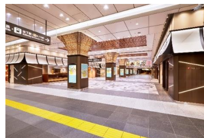
<東京ギフトパレット 外観>

URL： https://www.tokyoeki-1bangai.co.jp/tokyogiftpalette/