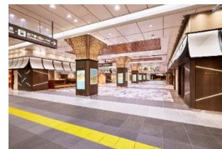
東京ギフトパレット外観

U R L： https://www.tokyoeki-1bangai.co.jp/tokyogiftpalette/ (東京ギフトパレット 特設サイト)