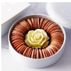
リングベリー ローズホワイトチョコ