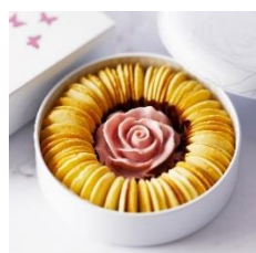
リングバニラ ローズチョコ

フランス産の素材を使用した、濃厚で味わい深いバラの形のチョコレートは華やかでパッと目を引く可愛らしさ。 チョコレートとラングドシャの相性は抜群で、とろける2つの食感をお楽しみいただけます。