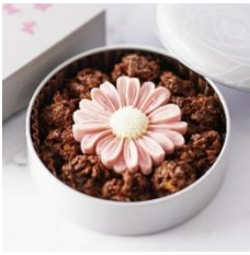
ガーベラクランチ チョコ