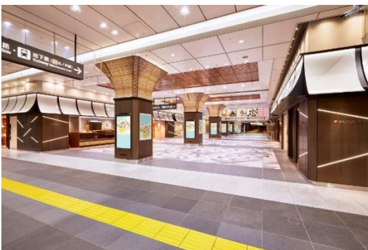
<東京ギフトパレット外観>

U R L： https://www.tokyoeeki-1bangai.co.jp/tokyogiftpalette/ (東京ギフトパレット 特設サイト)