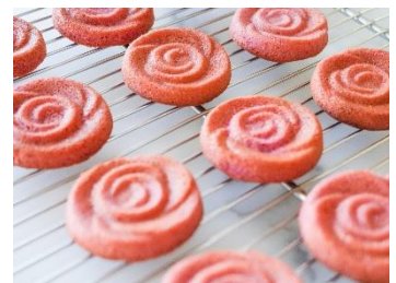
東京ギフトパレット先行販売 「東京ロージア フィナンシェ（ラズベリー）」

※価格はすべて税込価格です。 ※本リリースの画像はイメージです。 ※本リリースの内容は変更になる場合があります。