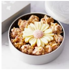
ガーベラクランチ ホワイトチョコ

砕いたラングドシャを使用したクランチはサクサクと軽い口当たり。 フランス産の濃厚なチョコレートとミルクィなラングドシャ、香ばしいナッツが絡まり 合い、ハーモニーを奏でます。